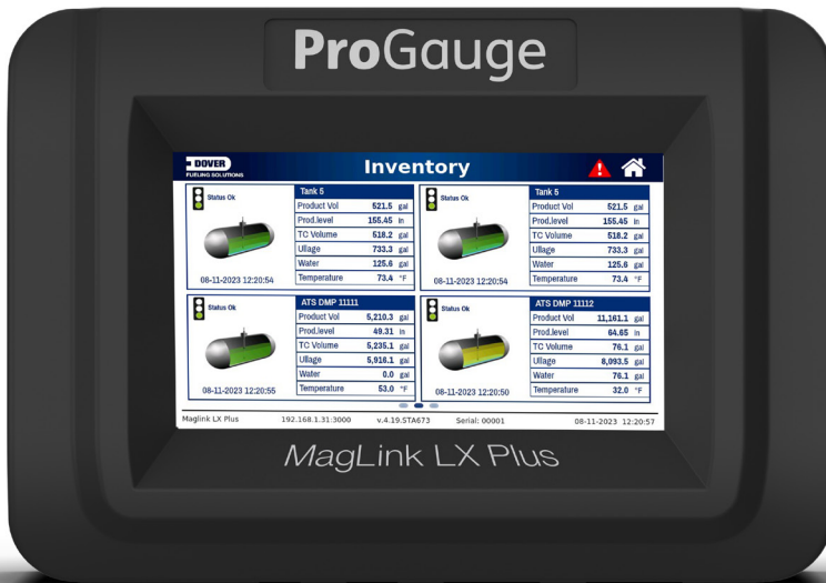
Konsola ProGauge MagLink LX Plus

Konsola ProGauge MagLink LX Plus jest wyposażona w jasny 7-calowy kolorowy wyświetlacz z inteligentną technologią „dotykania i przesuwania”. MagLink LX Plus to konsola zaprojektowana do skalowania. Dzięki możliwościom monitorowania podstawowego do 12 sond (sprzężonych z opatentowaną technologią „multi-drop”, która zmniejsza koszty instalacji) konsolę tę można łatwo ulepszyć, wzbogacając o ciągłe statystyczne wykrywanie wycieków (CSLD), elektroniczne wykrywanie wycieków w przewodach pod ciśnieniem (PLLD), przekaźniki lub połączenia wejściowe i nawet 48 czujników.