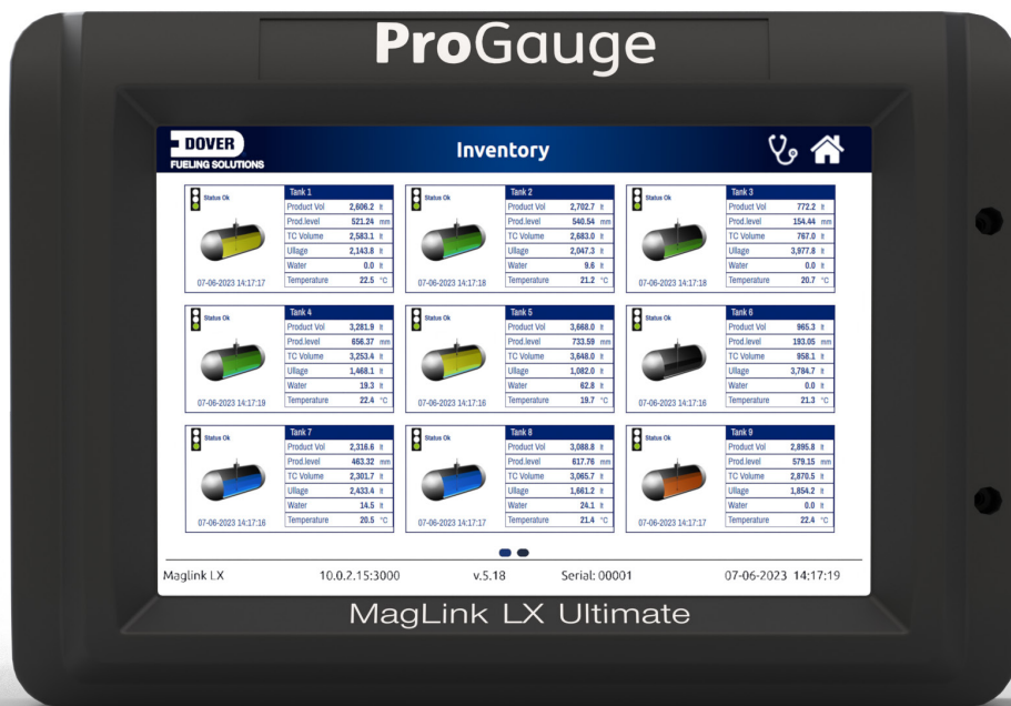
Konsola ProGauge MagLink LX Ultimate

Konsola ProGauge MagLink LX Ultimate® łączy do już dobrze znanej rodziny MagLink LX®, wraz z modelami MagLink LX Plus® i MagLink LX 4®. Konsola ta ma większą moc obliczeniową, duży, szybko reagujący ekran dotykowy i zwiększoną łączność z sondami i czujnikami. Mówiąc najprościej: model MagLink LX Ultimate jest większy i lepszy.