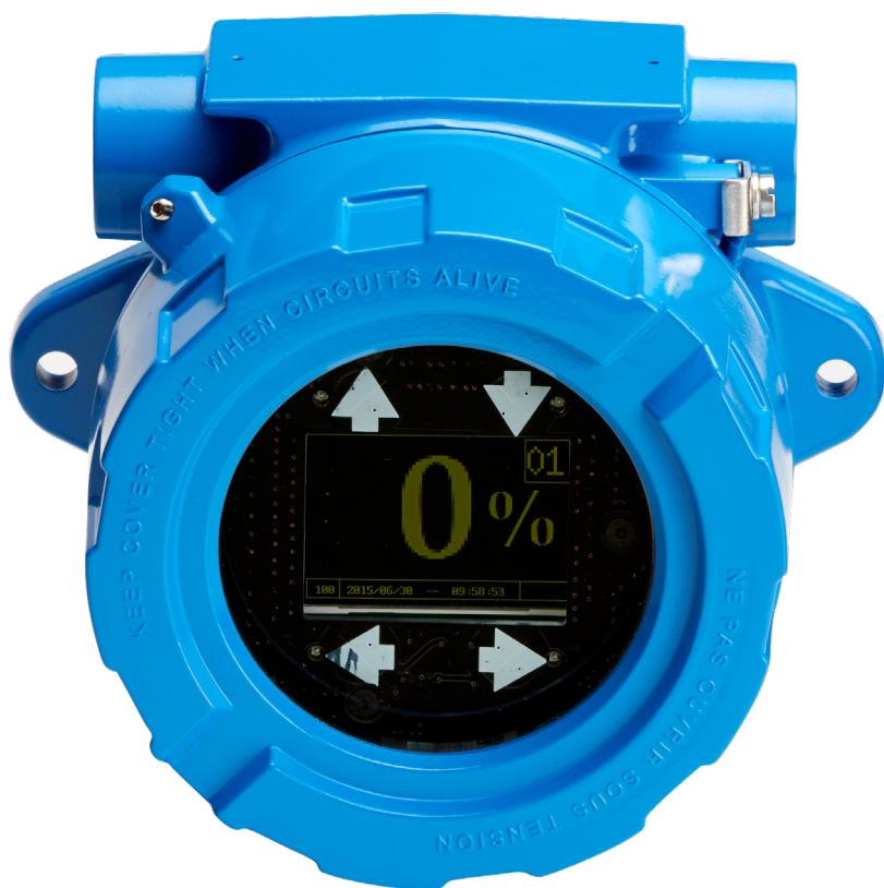
Konsola ProGauge DigiMon 16T

Zasilanie 9–30 V DC i bateria wewnętrzna z pomiarem na żądanie za pomocą magnesu w przypadku utraty zasilania konsoli