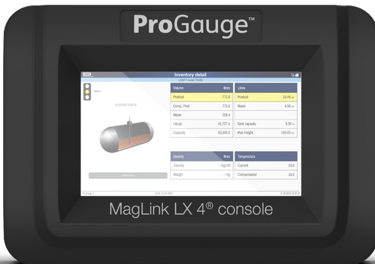
Konsola ProGauge MagLink LX 4

MagLink LX to bogate w funkcje rozwiązanie oparte na platformie Linux pozwalające na elastyczne konfiguracje do wykorzystania w różnych konfiguracjach paliwowych — zarówno przewodowych, jak i bezprzewodowych. Ta konsola może bez problemu obsługiwać nawet 32 sondy. Oparty na sieci internetowej i łatwy w obsłudze interfejs użytkownika zapewnia operatorowi szybki dostęp do wielu uproszczonych menu. Konsola obsługuje różne interfejsy punktów sprzedaży (POS).