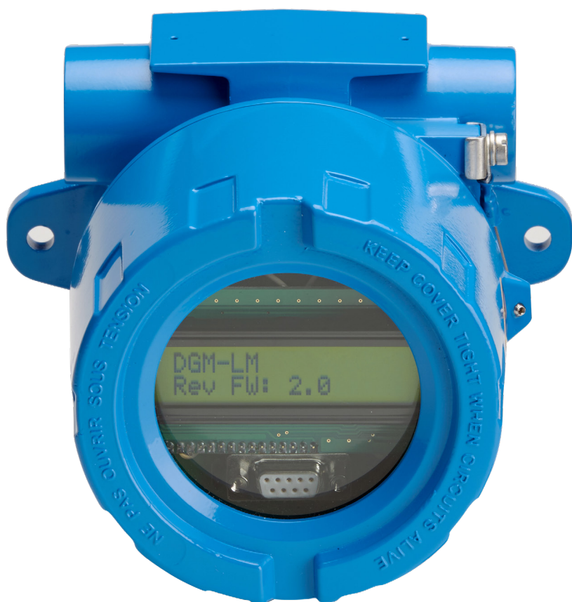
Konsola ProGauge Digimon LCD ATEX

Zasilanie 9–30 V DC i bateria wewnętrzna z pomiarem na żądanie za pomocą magnesu w przypadku utraty zasilania konsoli